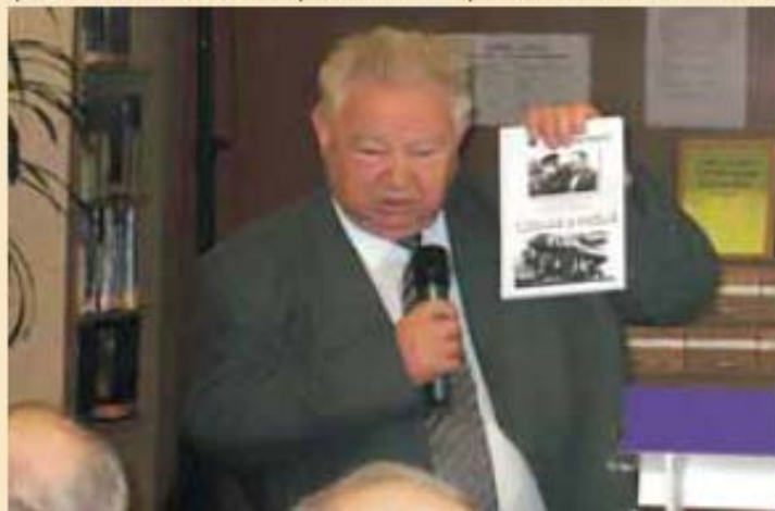
Космонавт Георгий Гречко сожалеет, что эта книга не вышла на 20 лет раньше