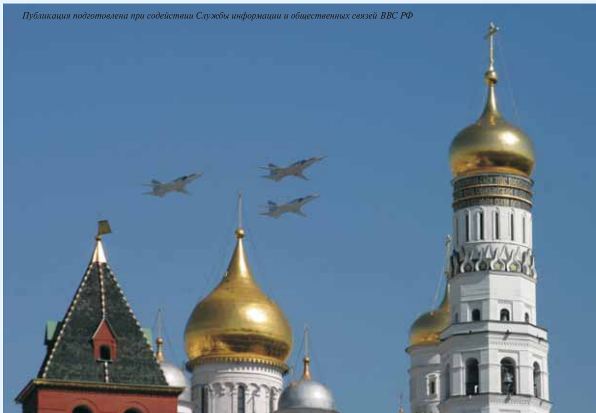
9 мая 2009 г. над Красной площадью в парадном строю пролетели более 70 самолетов и вертолетов, в том числе и новые образцы авиационной техники.

Публикация подготовлена при содействии Службы информации и общественных связей ВВС РФ